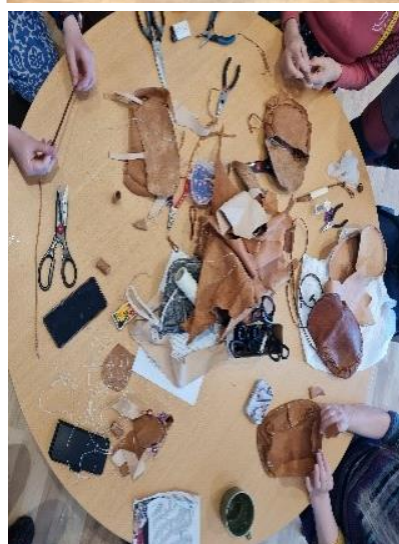
Foto: Bárru giellabáiki, Viesterállasis/Lufuohtas, i midten: fra luhkka- veiledning i Lofoten, og fra stillan på Taen i Melbu, til høyre: tema veske på giellakafea