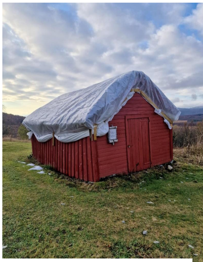
Foto: Sikring av eldhuset på Gállogieddi

Várdobáiki museum har drifts- og forvaltningsansvar for Gállogieddi samiske friluftsmuseum. Vi registrerer at en rekke bygninger på tunet har behov for istandsettinger, noe som er naturlig etter over 30 år siden oppbygging av tunet. Várdobáiki museum har derfor sikret to byggverk i 2023 som det skal foretas framtidig restaurering på. I 2023 ble det prosjektert istandsetting av eldhuset, mens låvebru, brønnehus og skjelterskjå er framtidige istandsettingsprosjekter. Sikringstiltak og mindre reparasjoner på museumsanlegget utføres kontinuerlig av vaktmester.