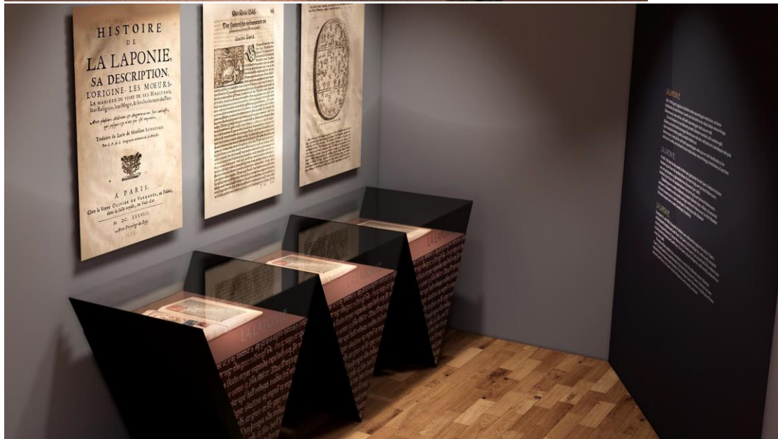
Hilla – min muitalusak – under ferdigstilling