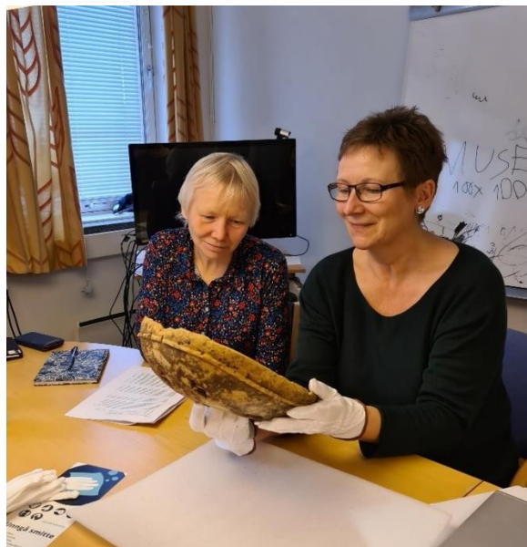
Daglig leder og styreleder beundrer Hilssátromma

Samlingsforvaltning har vært et innsatsområde til Várdobáiki museum i 2020. I dette arbeidet har det vært sentralt å lene seg mot institusjoner med kompetanse innen samlingsforvaltning og gjenstandskonservering Gjennom Bååstede prosjektet har Várdobáiki fått formell tilbakeføring av 31 gjenstander som fortsatt ligger på Norsk folkemuseum. I tillegg er Várdobáiki i dialog med andre museer angående utlån av andre sentrale gjenstander som skal inngå i Várdobáikis permanente basisutstilling. Deriblant Hilssa-tromma som for øyeblikket befinner seg på Tromsø Museum. Gjenstandene tilbakeføres når det er etablert forsvarlige oppbevaringsforhold. Derfor har Várdobáiki innledet et samarbeid med Tromsø museum, som har bistått med kompetanseheving i magasinerings, konservering og samlingsforvaltning. Museet har etablert rutiner og et forrom/mottakrom for gjenstander som skal magasineres ved Várdobáiki museum. I denne sammenhengen har museumsleder fått grunnleggende opplæring i gjenstandskonservering fra Tromsø museum