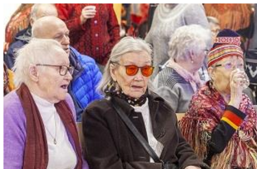
Fra åpningen av Várdobáiki, tradisjonsbærere og språkressurser.