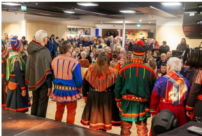
Vardobiegga underholder under åpning av Várdobáikis nye lokaler

Sanggruppen Várdobiegga har øvelser 2-4 ganger pr mnd. I periodene hvor det ikke har vært mulig å møtes for å øve har sanggruppen arrangert digitale øvelser. Dette har vært en utfordring, men likevel fungert på et vis. Sanggruppen er en godt fungerende samisk språkarena. I 2020 har gruppen hatt fem opptredener, på åpning av Várdobáiki, på bokslipp, sesongåpning på Gállogieddi, på sannhetskomisjonens seminar og på seminaret om tradisjonell reindrift på Várdobáiki. I tillegg under en begravelse. De planlagte prosjekt i samarbeid med partnere fra russisk side kunne ikke gjennomføres.