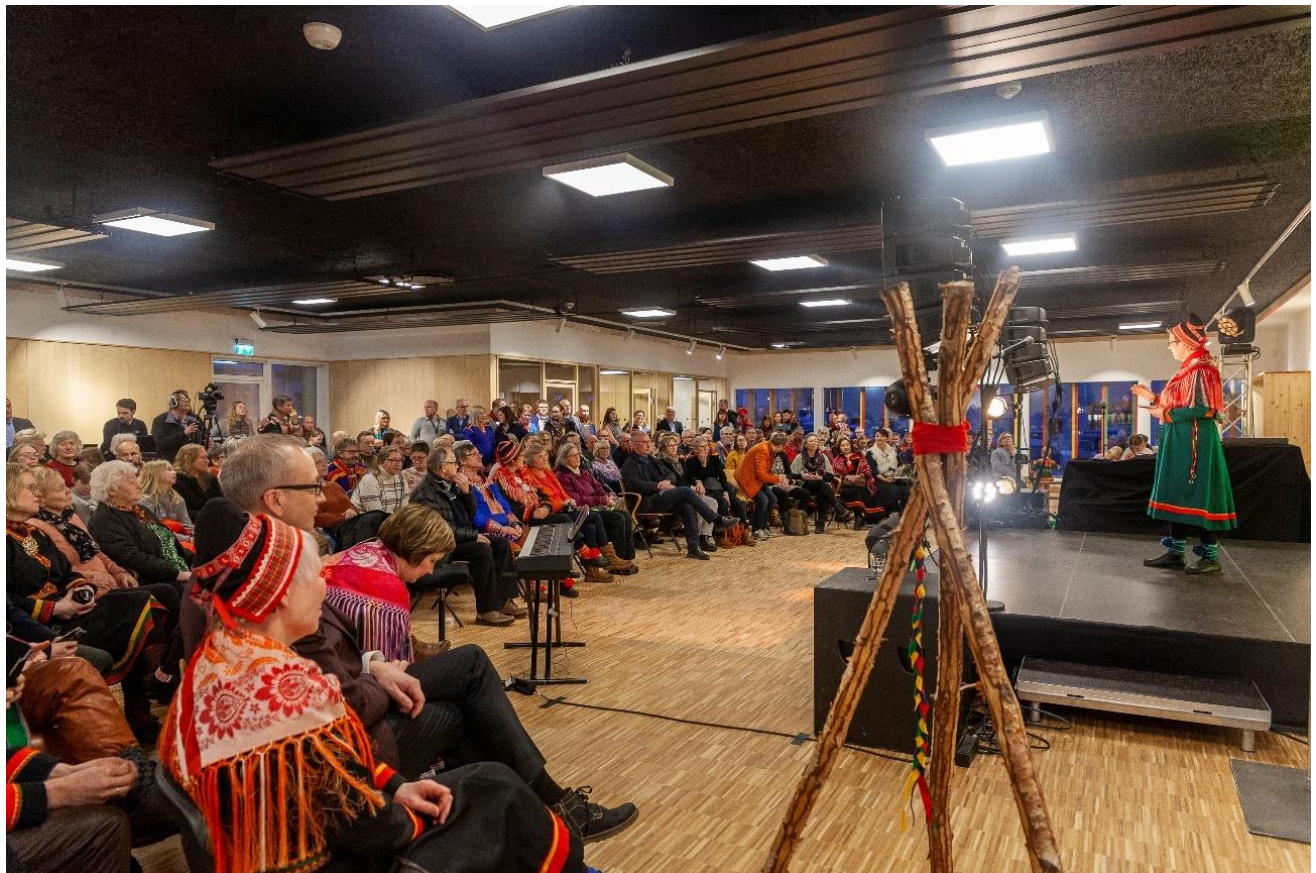
Fra åpningen av nye Várdobáiki, 1.februar 2020