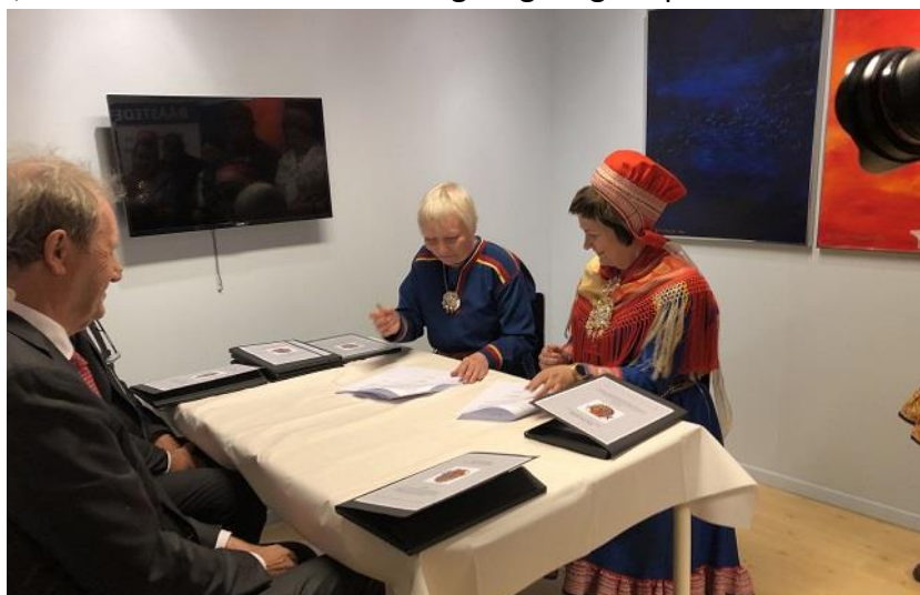
Signering av Bååstede s dokumer

Gjennom Bååstede prosjektet har Várdobáiki fått formell tilbakeføring av 31 gjenstander som fortsatt ligger på Norsk folkemuseum. Gjenstandene tilbakeføres når det er etablert forsvarlige oppbevaringsforhold. Avtalen om tilbakeføring ble signert av Sametinget, Norsk Folkemuseum, Kulturhistorisk museum og Várdobáiki samiske senter i mai 2019.