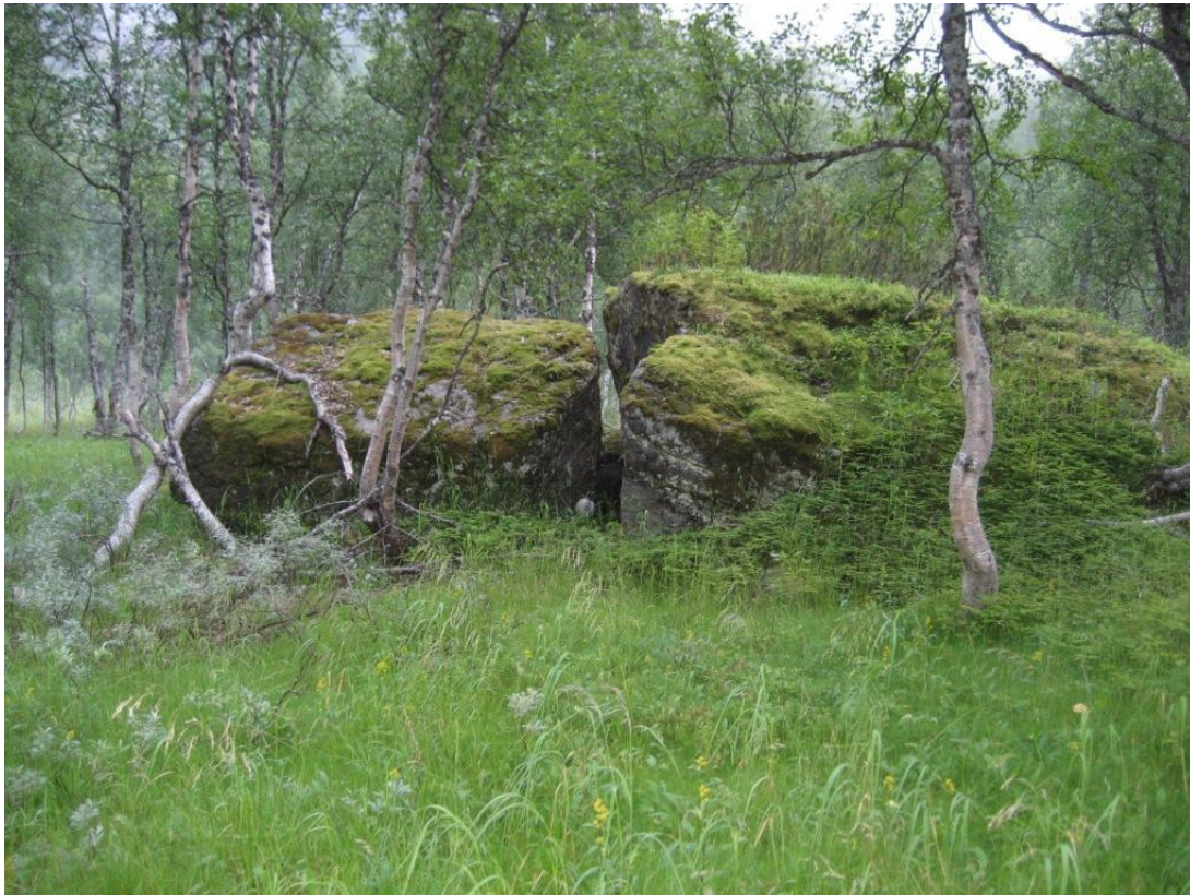
Kulturminne i Revdalen