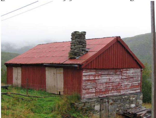
Øyvann, Skånland / Suolójávri, Skánit