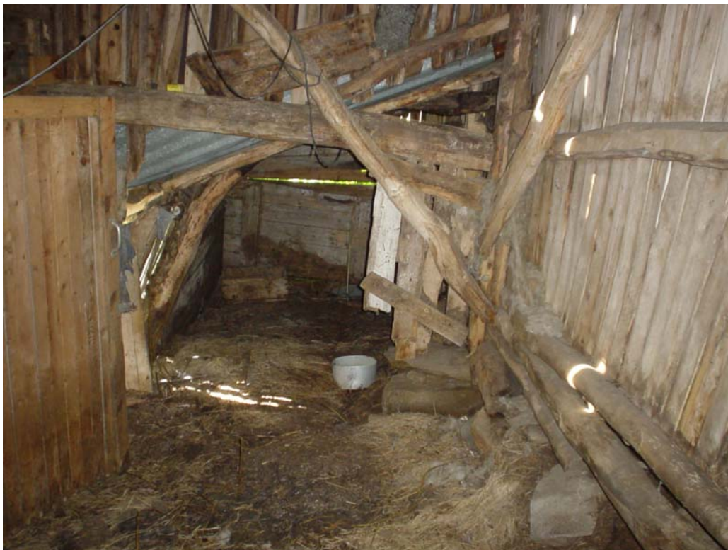
Inni fjøsgamme i Brenna, Evenes / Vieksesgoađis, Evenášši

Várdobáikki mielas lea dehálaš fállat sámeigielat kulturdáhpáhusaid vai mánát ja nuorat movttáskit váldit ruovttoluotta sámeigiela. Várdobáiki lea vássan jagi leamaš Beaivváš Sámi Teáhtera ja Girona Sámi Teáhter báikkálaš lágidanveahkki.