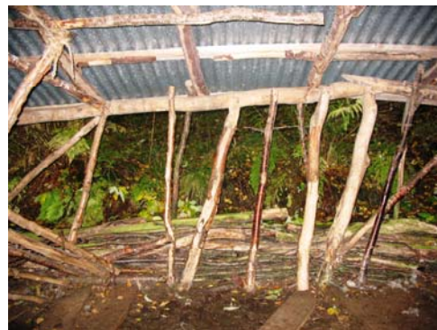
Sommerfjøs for sau av kvist, Evenes / Sávvzaid gassevieksi, Moskeroggi Evenášši