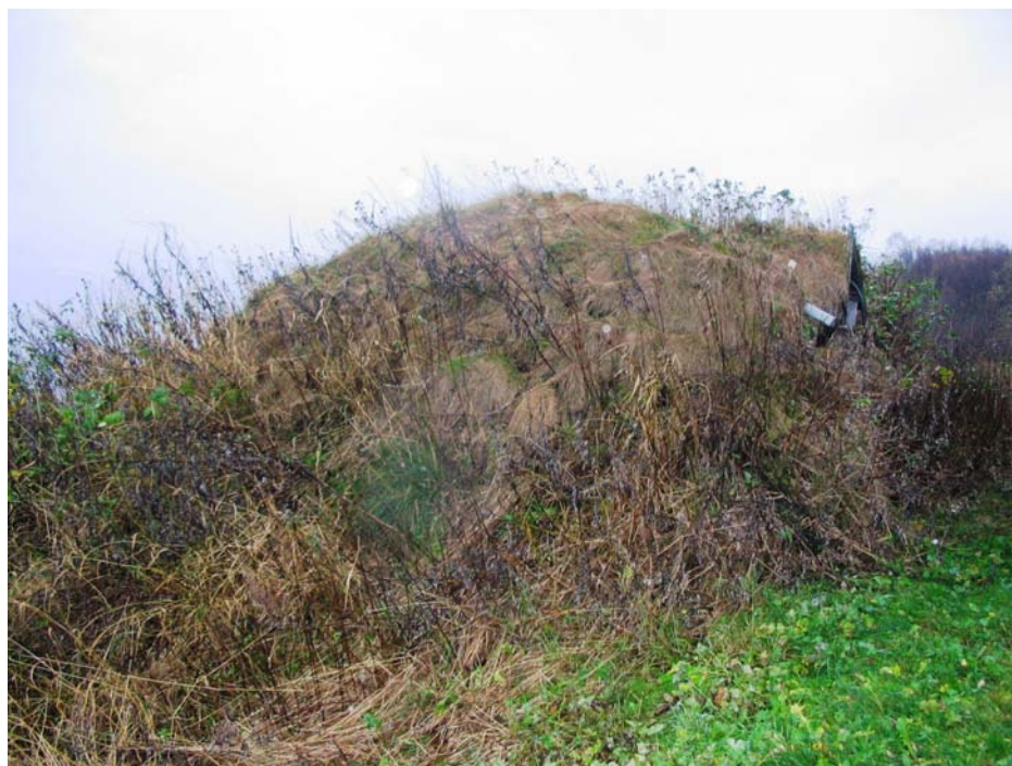
Fjøsgamme, Veggen i Evenes / Vieksegoahti, Veaggu Evenášši