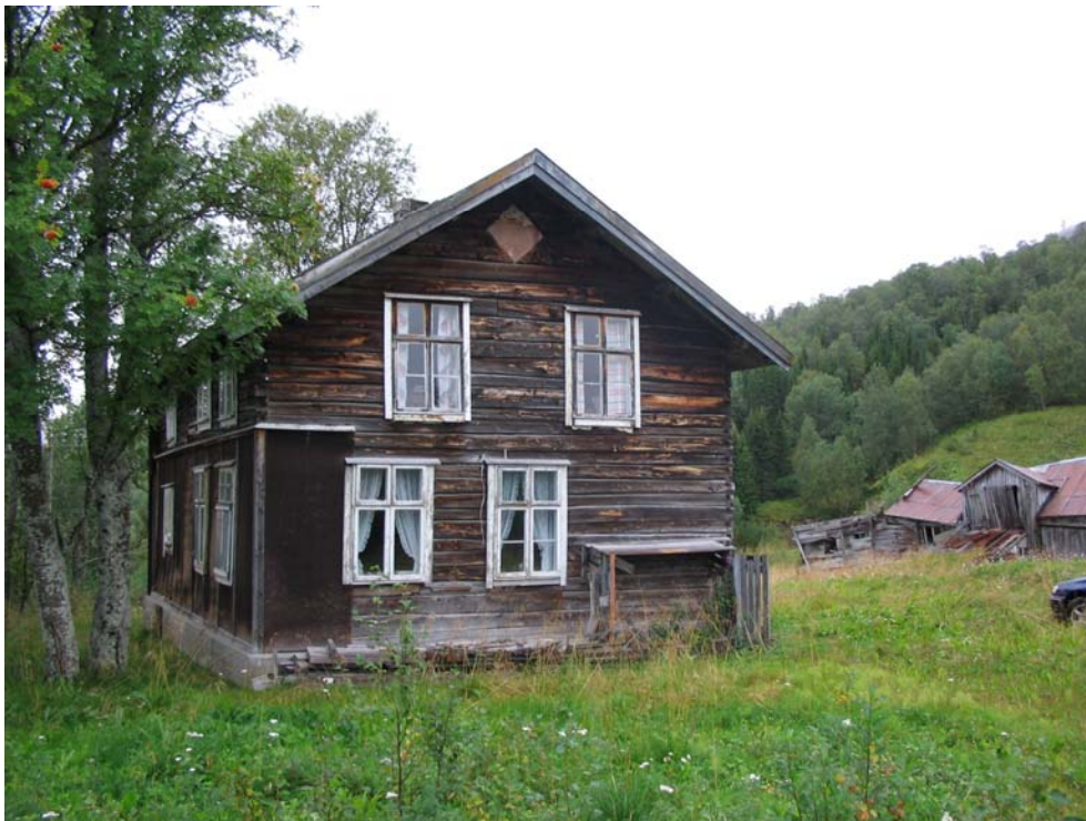
Skolpie, Kalvåsen, Ballangen / Skoalpi Bálagis