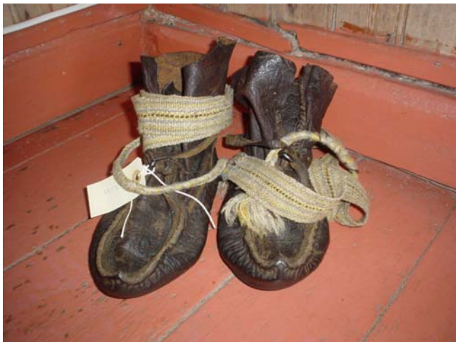
Čážehat ja vuoddagat, Gállogieddi Gamle brukskomager med band, Gallogiedde