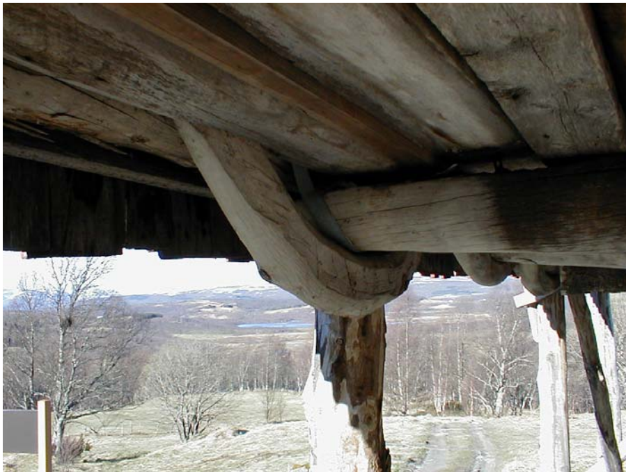
- Spesiell byggeteknikk, fjøset på Gallogiedde - Sierra huksenmákke, Gállogietti vieksi

Som et ledd i å motivere barn og unge til å ta tilbake samisk språk synes Várdobáiki det er viktig at det tilbys samiske kulturtilbud. Várdobáiki har i løpet av året stått som lokal arrangør for teaterforestillinger med Beaivváš Sámi Teáhter og Sámi Teáhter fra Kiruna.