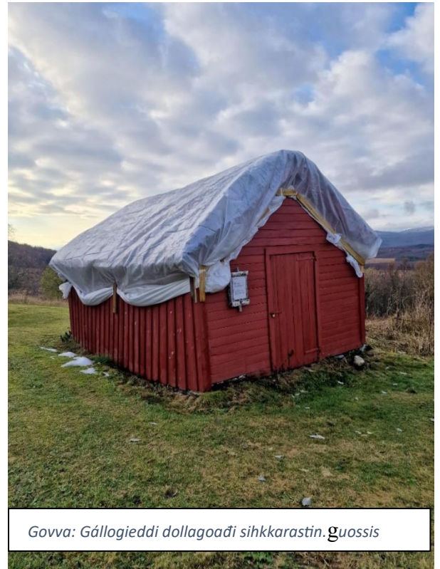
Govva: Gálgieddi dollagoađi sihkkarastin.guossis

Musea lea leahkán rabas geassemánu 1.beaivvi rájes gitta borgemánu 15.beaivái. Logi ofelačča leat leahkán virgáiduvvon ja sii leat bargan sihke Gálgietti ja Várdobáikki museas. Lea stabiila gussiidlohku. Museas lea leahkán mángga joavkku, sihke rávisolbmot ja mánát leat leahkán guossis geasseáigge.