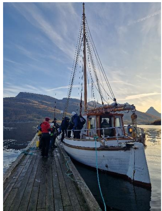
Govva: Varrisvuodagámnnadeapmi mannamis vanccain fávlái

2023:is Várdobáiki čadahii 9 varrisvuodagámnnadeami ja ovtta varrisvuodagámnnadeami mátkkis. Mátki manai Roabadállui ja Rivttágii gonne oasseváldit ledje vanccain mielde Ástavierdas.