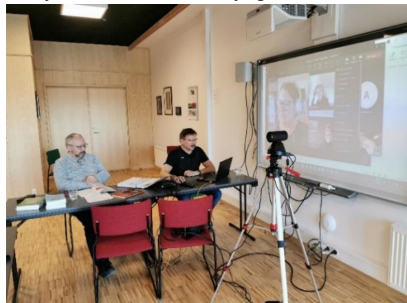
Govva: Giellakursa ohppiiguin geahkas čuovvot kurssa digitálalaččat

Gielladoaimmabijut ruhtaduvvojit doaimmaruđaguin maid Sámediggi ja Romssa ja Finnmárkku fylkkasuohkan juolludit. Giellaguovddáša hálddahušlaš doaimma lea leahkán čuovvolit gaitdin gielladoaimmaid masa Sámediggi addá doarjaga, plánet dálá ja ođđa gielladoaimmaid, čuovvolit aktavuodaid maid bohtet giellaguovddášii, raporteret Várdobáikki giellaguovddáša ja Bárru giellabáikki doaimmaid birra, ja vel fágalaš ja bargiidovddasvástádus giellamielbargiin.