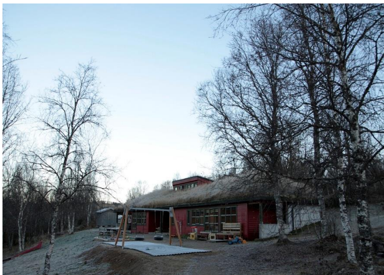
Márkománák samisk barnehage, Planterhaug i Skånland.

Barnehagen har fra 2012 hatt samordna opptak med kommunen. Barnehagens opptakskrets er Skånland og Evenes kommuner. De som søker til Márkománák må søke gjennom kommunens hjemmesider. Styrer er med på opptaket.