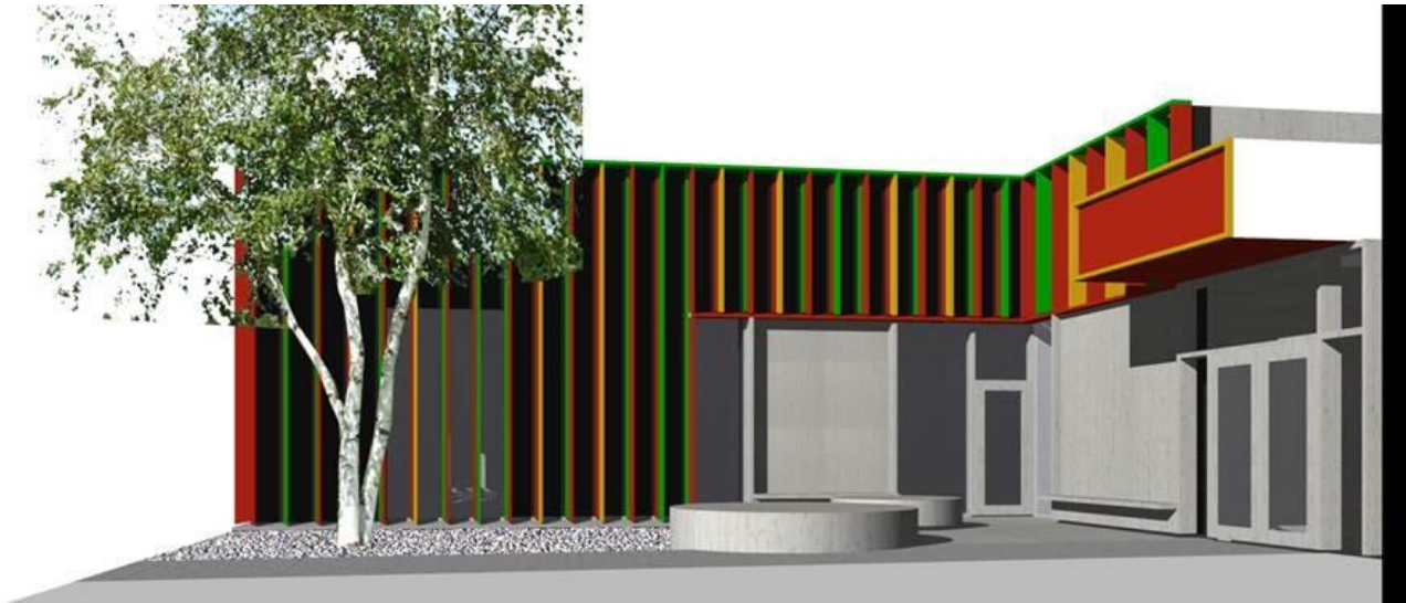
Várdobáiki etter renovering av bygg. Skissetegning ved Code arkitektur AS