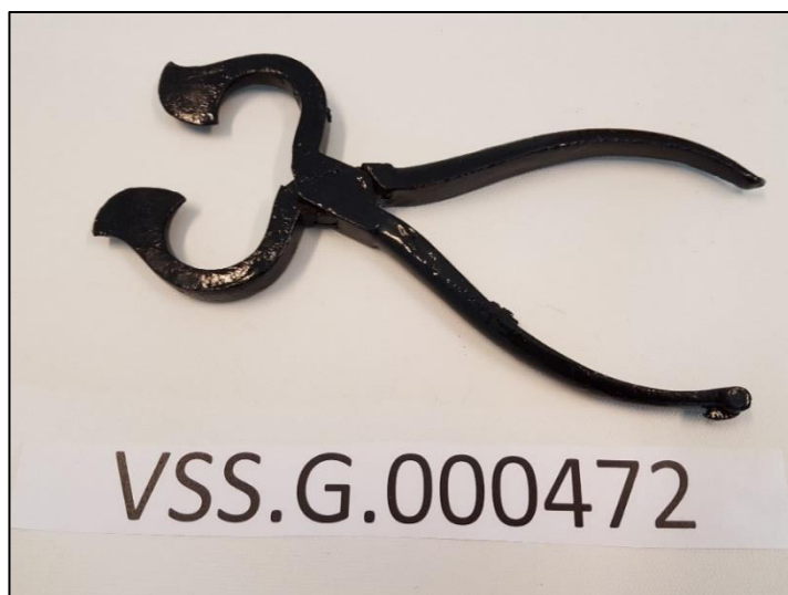
Sukkertang. I 2018 ble de fleste gjenstandene i museet registrert i PRIMUS