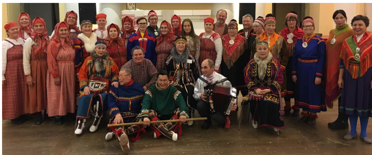
Várdobiegga på tur i Arkangelsk regionen. Samarbeid med grupper fra Naryan-Mar og Arkangelsk