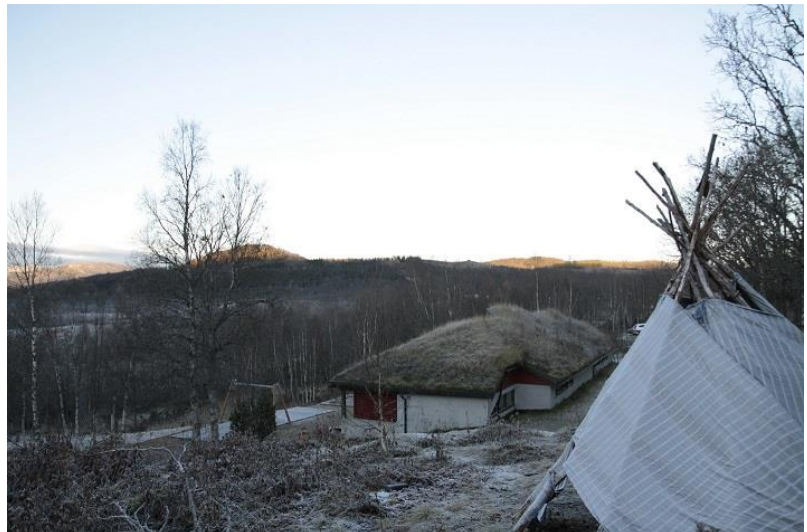
Márkománák sámi mánáidgárdi. Lánttedievá. Skánit

Giellaáŋgiruššan sámegeiela ektui lea vuosehan bohtosiid. Mánát sámegeiela ruovttugiellan sámasta henup mánáidgárddis ja mánát geainnas eai leat sámegeiela ruovttugiellan lea ožžon buoret sátneriggodaga ja ságastallet sihke sámegillii ja dárogillii.