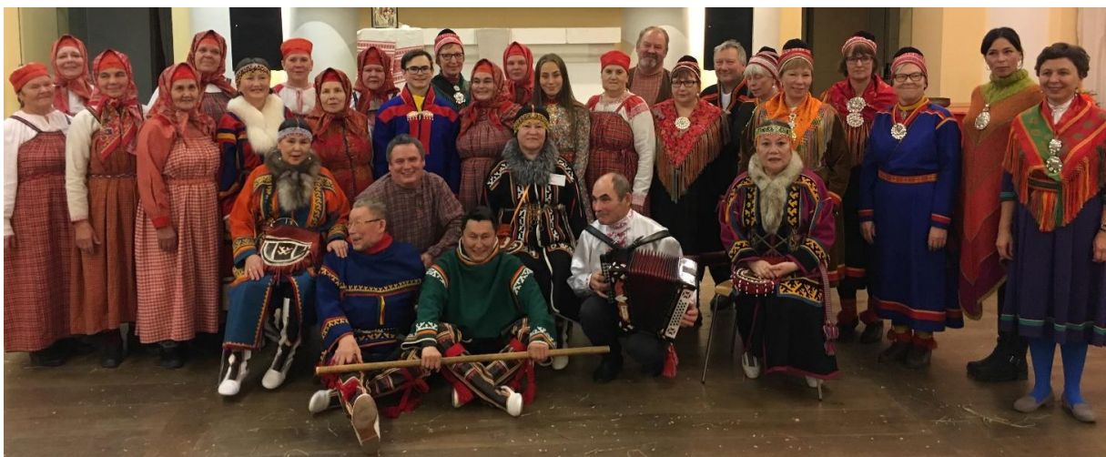
Várdobiegga mátkkis Arkangela regiivnnas. Ovttasbargu joavkuiguin Naryan-Maras ja Arkangelis